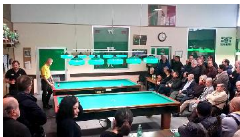
Panoramica del pubblico nel torneo del Ambrogino D'Oro