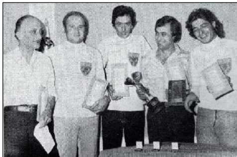
Esultanza della squadra vincitrice